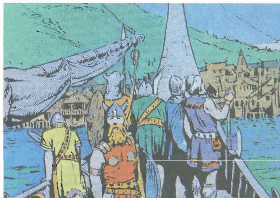
Recken runderneuert: Jetzt sitzen die Farben exakt in den Tusche-Konturen von Hal Fosters Zeichnung, die Alterungsspuren sind beseitigt und insgesamt ist die Farbgebung nicht mehr so knallig wie im alten Zeitungsdruck.