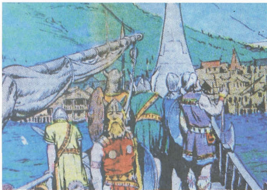
Recken im Original: Gleich mehrere korrekturbedürftige Bildfehler zeigt dieser Druck – altersbedingte Vergilbung, nicht konturengenaue gedruckte Farben, zu starke Farbsättigung.

Dann wird Bild für Bild ausgebessert. Zuerst wird die schwarze Strichzeichnung herausgearbeitet. Vor allem Graustufen von Farbrastern müssen weg. Mit dem Photoshop-Werkzeug „Schlinge“ werden die Flächen ausgewählt, dann veräußert, schließlich die Linien weichgezeichnet und erst ganz am Ende nachgeschärft. Besonders mühsam ist das in den nicht eben wenigen Bärten des Ritter-Epos; Da soll beim Reinigen kein Haar entfallen, andererseits dürfen keine Res-